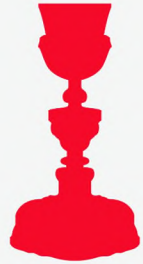
Damián de Castro. 1776

El periodo artístico del siglo XVIII es, sin duda, el más importante de la platería cordobesa , pues en esta centuria, además de triunfar el barroco, se desarrolla de manera excepcional el rococó , coincidente con su momento de mayor esplendor.