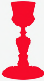
Rodrigo de León. 1591